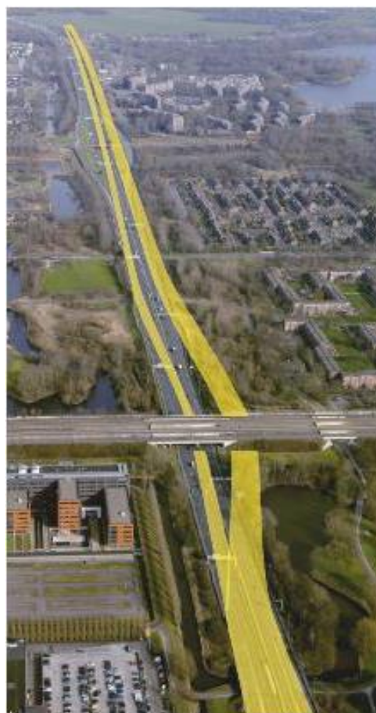
Afbeelding: tijdelijke situatie na de zomer 2016

Tijdens de bouw van de nieuwe A9 en de aanleg van de tunnel, rijdt het verkeer op de snelweg ter hoogte van de spoorlijn over vijf tijdelijke rijstroken ten zuiden van de huidige snelweg. Twee rijstroken blijven op de huidige snelweg beschikbaar. Voor de aanleg van deze tijdelijke rijstroken maken we een extra onderdoorgang onder de spoorlijn Amsterdam-Utrecht.