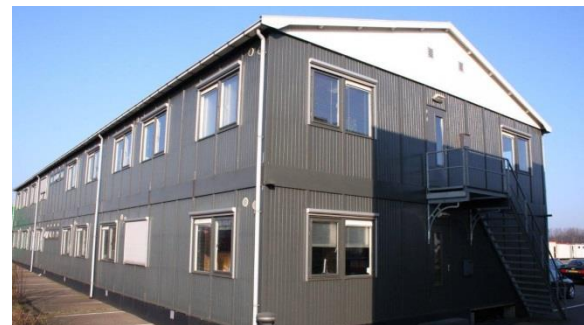
Afbeelding: het soort bouwkeet dat aan de Langbroekdreef komt

Het inrichten van het terrein en het plaatsen van de bouwkeet gebeurt in de maanden juni en juli. De keet, die twee verdiepingen heeft en een pindak, wordt in onderdelen aangevoerd en ter plaatste in elkaar gezet. Naar verwachting is de keet half juli klaar.