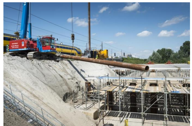
Afbeelding: de meeste palen voor de fundering zitten inmiddels in de grond