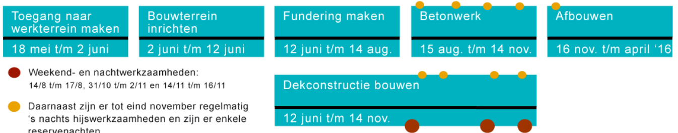
Afbeelding: de globale planning van de werkzaamheden. Deze kan door omstandigheden wijzigen