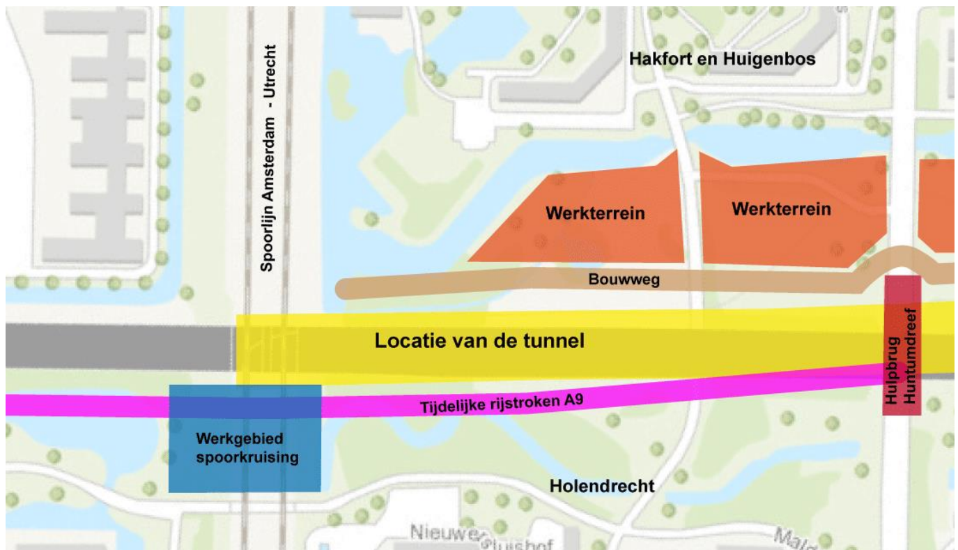
Afbeelding: een globale schets van de tijdelijke rijstroken, locatie van de tunnel, bouwwegen en werkterreinen bij de spoorkruising.

Tijdens de werkzaamheden is een aantal van de gebruikelijke fiets- en voetpaden onder de A9 door afgesloten.