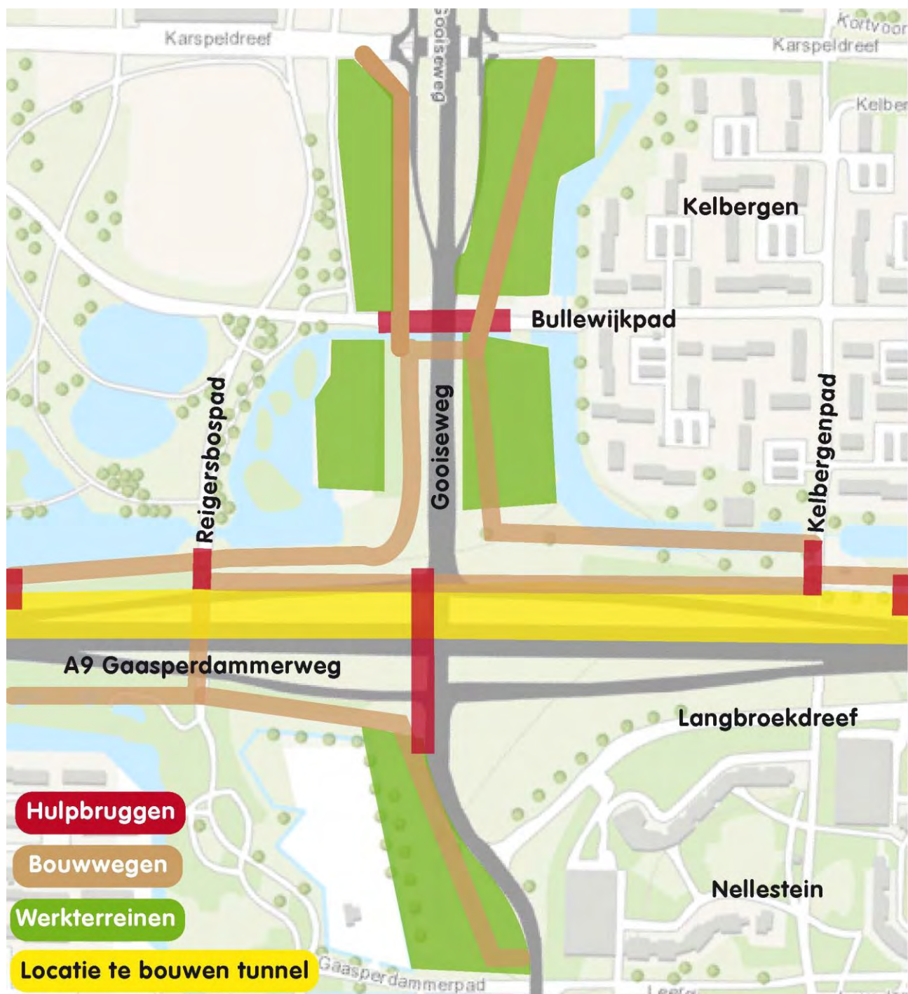
Afbeelding: een globale schets van de bouwwegen en werkterreinen rondom de Gooiseweg

IXAS maakt als eerste het wegdek van de middelste tunnelbuis: in de toekomst wordt dit de wisselbaan. Deze wisselbaan wordt vanaf maart 2016 gebruikt door snelwegverkeer. Om de wisselbaan te kunnen maken, voeren we graafwerkzaamheden uit, brengen we damwanden en verankeringen aan, ontgraven we de ondergrond, heien we funderingspalen en maken we de vloer van de wisselbaan. Het maken van de wisselbaan vindt plaats tussen half augustus en februari 2016.