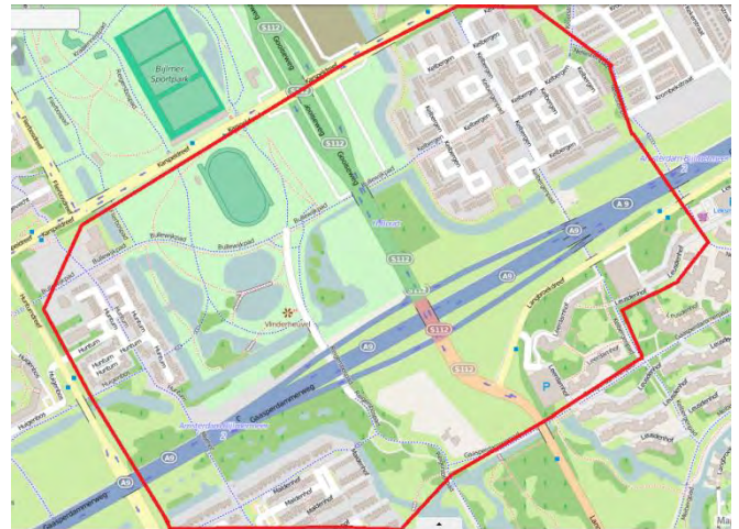
Afbeelding: binnen de rode lijnen wordt dit bouwbericht bezorgd.

Uw mening geven over de werkzaamheden aan de A9? Dat kan door lid te worden van het A9 Omgevingspanel. Het panel geeft twee keer per jaar haar mening over de mate van hinder die zij ervaren en de communicatie over de werkzaamheden. Meld u zich aan op www.A9omgevingspanel.nl