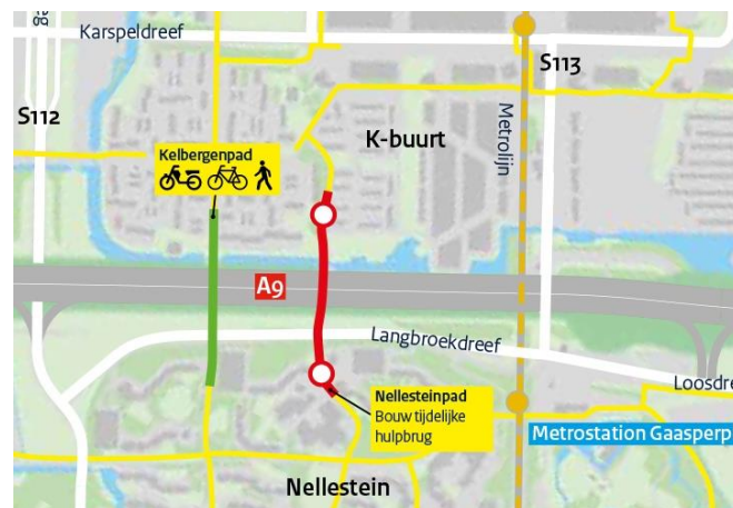
Afbeelding: de oversteekmogelijkheden voor fietsers en voetgangers van maandag 10 augustus tot en met vrijdag 2 oktober

Tijdens de bouw van de hulpbrug is het Nellesteinpad dicht: van maandag 10 augustus tot en met vrijdag 2 oktober. Het Kelbergenpad is in deze periode open. Zo kunt u toch de A9 kruisen. Op maandag 5 oktober wordt het Kelbergenpad afgesloten. Dit blijft zo tot het einde van het project in 2021. Het Nellesteinpad is dan weer open. Op 5 oktober opent ook een nieuwe oversteekmogelijkheid voor fietsers en voetgangers bij de Kromwijkdreef. Op bijgaande grote afbeelding ziet u ook voor de rest van de A9 welke fietspaden open blijven en dicht gaan.