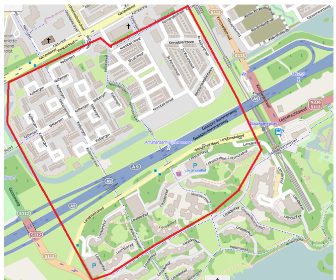
Afbeelding: binnen de rode lijnen wordt dit bouwbericht bezorgd.

U krijgt deze bouwberichten over de werkzaamheden in uw directe woonomgeving in de brievenbus. Wilt u goed op de hoogte blijven van alle werkzaamheden die IXAS aan en rondom de A9 verricht? Abonneer u op het digitale voortgangsbericht. Dit kan door een e-mail te sturen met uw naam, adres en e-mailadres naar communicatie@ixas.nl .