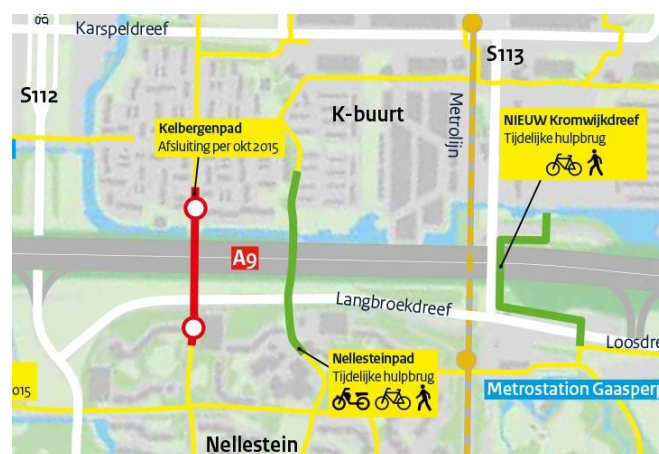
Afbeelding: de oversteekmogelijkheden voor fietsers en voetgangers vanaf maandag 5 oktober